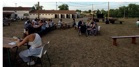
20 ans du Centre Équestre de Beausoleil