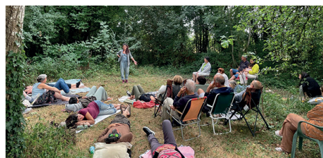
Sieste contée à Mautré Traverse !