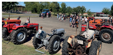
Défilé de vieux tracteurs de la Fonvéroise