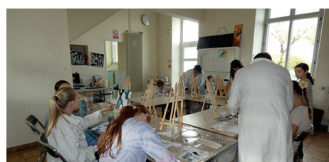
Stage d'arts plastiques Azarts