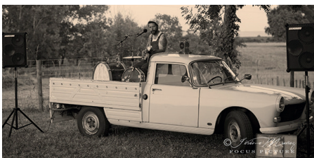
Apéro concert «Pick me up» à Mons