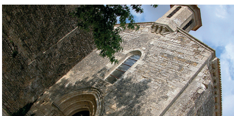
Journées du patrimoine visite de l'Église