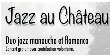
Jazz manouche au château de Fonvérines