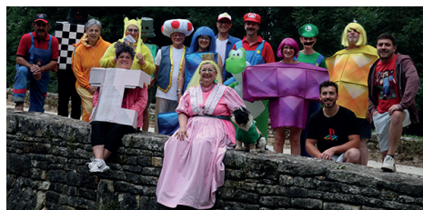
Rallye de la SEP