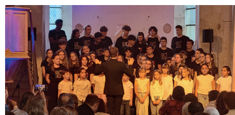
Chœur académique Acad'Ôchoeur