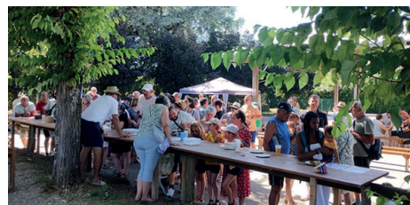
Fête des écoles de l'APE