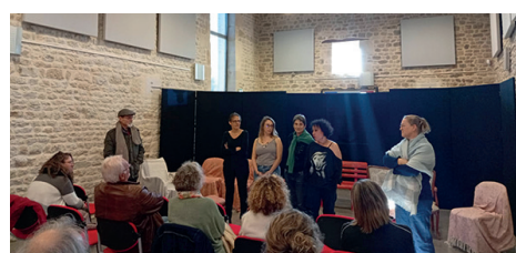
Théâtre de l'Envie d'Enfer «On croit qu'on vole»