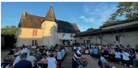
Apéro concert «Irish sky» à Fonvérines