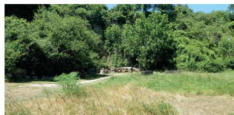
Sortie géologique à la carrière de Ricou